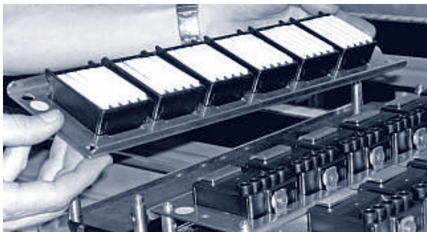
«Wir werden zweischichtig arbeiten, wenn die Stückzahlen zunehmen.» Walter Stocker zeigt einen Werkzeugträger mit 6 Fünferpatronen.

beitet werden, dazu muss der Einrichter den Halbautomaten jeweils umrüsten. «Wir hoffen auf mehr Stückzahlen, und werden, wenn es anzieht, in Zukunft auch zweischichtig arbeiten.»