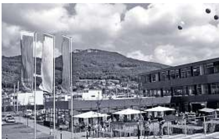
Der Neubau Berufliche Massnahmen präsentiert sich am Besuchstag im Sonnenschein.