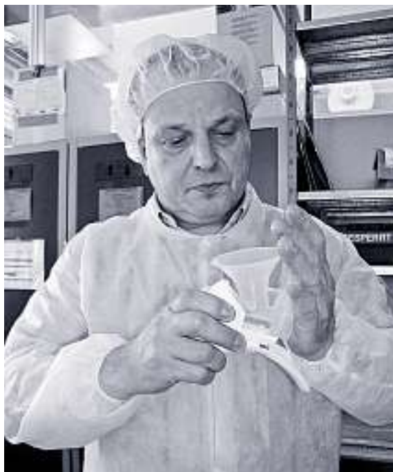
Konzentriert bei der Arbeit: Die Teile müssen richtig montiert werden.

Ihm selbst geht es nun psychisch wieder viel besser als früher. «Natürlich gibt es immer noch ein Auf und Ab», sagt er. Doch er sei viel stabiler geworden. Wenn es ihm schlechter geht – «wer mich kennt, merkt das» – zieht er sich am liebsten zurück. Er ist dann gerne in seinem Haus in Aarwangen oder in seinem