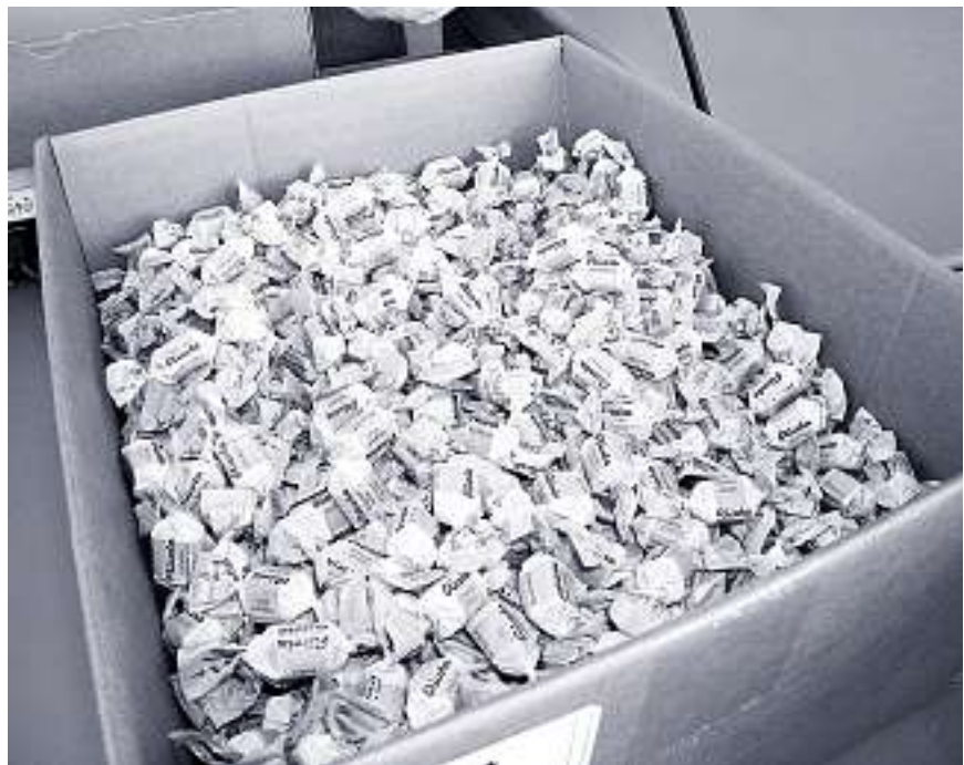
Wer kennt sie nicht, die berühmten Ricola-Täfelchen, oder «Gutzi», wie sie im Schwarzbubenland genannt werden.

Jochen Layer: «Es gibt Arbeiten, die sinnvoll nur von einer Behindertenwerkstätte ausgeführt werden können. Der soziale Gedanke steht im Vordergrund, trotzdem muss das